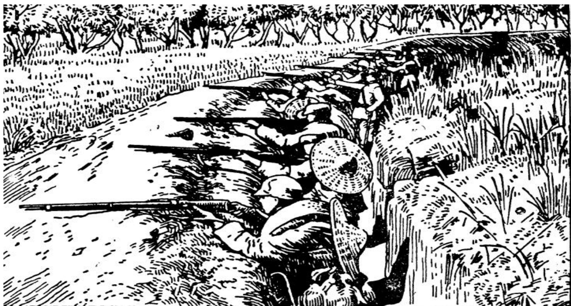
图 2-3 十九路军抗日图