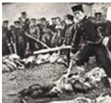
D. 日军在旅顺的暴行