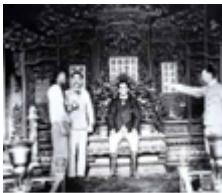
C. 侵略者坐在清朝皇帝的宝座上