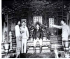
C. 侵略者坐在清朝皇帝的宝座上