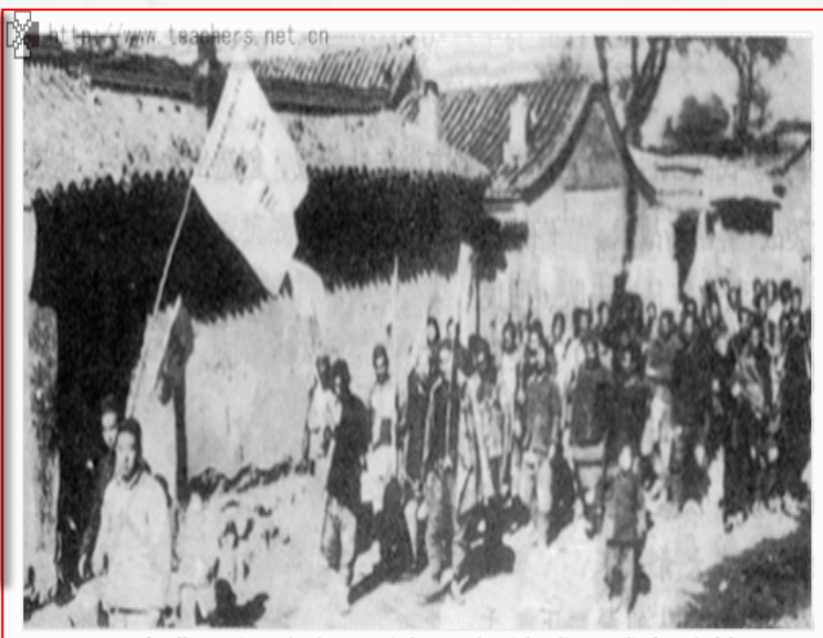
晋察冀根据地农民游行，拥护减租减息政策