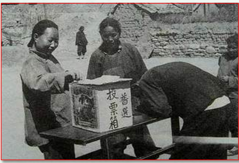
根据地进行民主投票