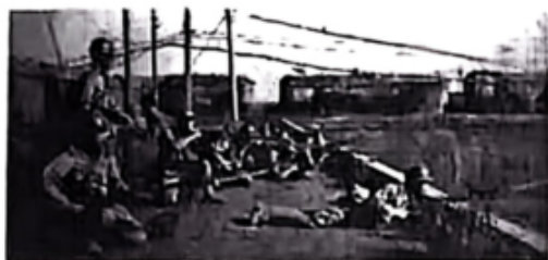
图一 1931年9月日军占领沈阳