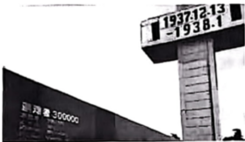
图三 南京公祭广场的标志碑