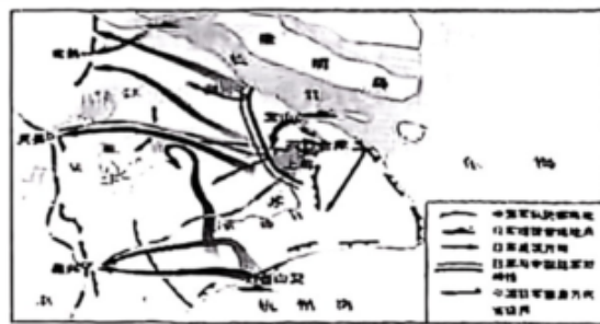
图四 淞沪会战示意图