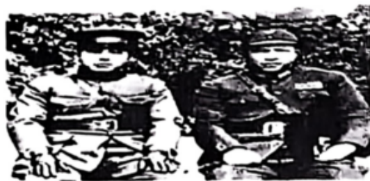
图二 张学良、杨虎城合照(1936年12月)