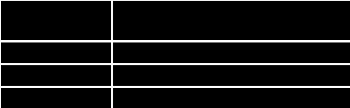
图2 全国规模以上工业企业新产品开发项目数_中外合作经营企业统计柱状图